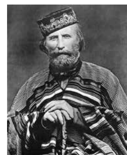
Giuseppe Garibaldi har fått ett eget torg uppkallat efter sig i Nice, Place Garibaldi.